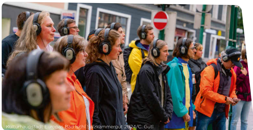
Kulturhauptstadt Europas Bad Ischl Salzkammergut 2024/C. Gutl