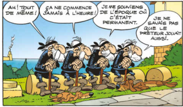
ASTERIX®-OBELIX®-IDEFIX® / ©2024 LES ÉDITIONS ALBERT RENÉ/GOSCINNY - UDERZO Extrait de l'album « Astérix en Corse »