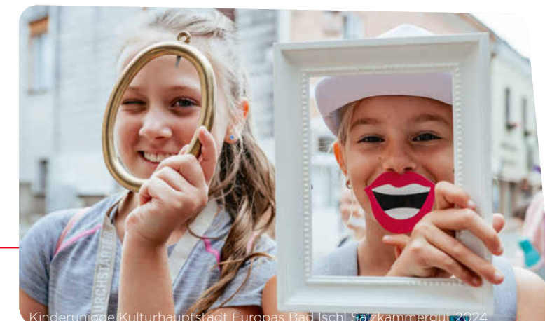
Kinderunioide Kulturhauptstadt Europas Bad Ischl Salzkammergut 2024